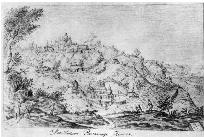
Het Holenklooster op een prent van Abraham Westerveld uit de zeventiende eeuw

Het Holenklooster werd vanaf 1051, toen de monnik Antonius een gat van vier meter in de grond sloeg, bebouwd met kerken. Antonius werd kluisenaar. Zijn jongere collega Theodosius schiep een toegankelijker wereld van kerken en kloosters. Rond 1900 waren er meer dan duizend monniken en seminaristen. In 1988 begon men op nul. Nu zijn er ruim vijfhonderd monniken in het Holenklooster. Het grootste deel hoort bij de OOK en moet weg.